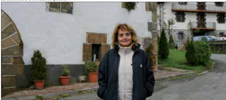
La alcaldesa a la entrada del pueblo.

Beruete es un ejemplo del rico patrimonio que encierran los pueblos pequeños de Navarra. Además de la iglesia de San Juan Bautista, que destaca en medio del caserío, en este pueblo llaman la atención sus grandes casonas de piedra con entramados de madera. El casco urbano forma además una especie de semicírculo, en el fondo de un valle rodeado de praderas. A este armonioso paisaje hay que unir el típico ambiente comunitario de un pueblo de 165 habitantes que desarrolla su vida en instituciones de larga historia y tradición, como la posada o la Sociedad. Frente a la visión pragmática y economicista que se tiene a veces del planeamiento, sería bueno ensayar una nueva mirada para descubrir la rentabilidad de los pueblos pequeños como este, y apreciar en su justa medida el papel que cumplen sus habitantes en la preservación y mantenimiento de la diversidad cultural de Navarra.