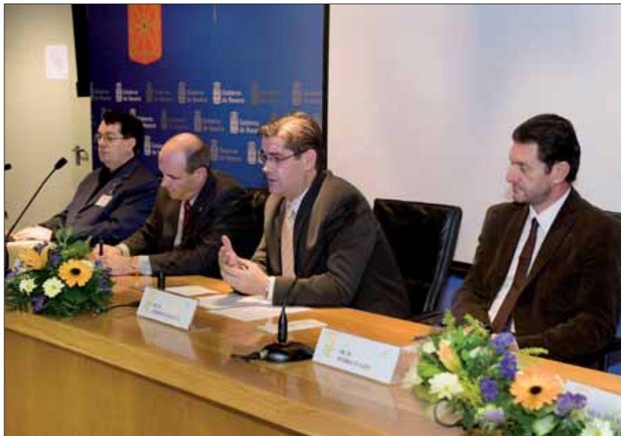
Momento de la apertura del foro de autoridades.