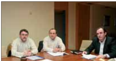
Miembros de la Ejecutiva en una reunión sobre el Fondo de Haciendas Locales.

los cargos públicos, y organizado y celebrado una nueva edición del Plan de Formación Continua de los Empleados Locales de Navarra.