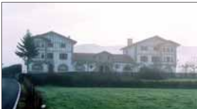
Utzamako Udala zahar-berrituko dute Estatuko Funttsaren kargura.

Proiektuak aurkezteko epea itxi arte aurkeztu direnatanik Ministerioak onartu duen obrarik garestiena Iruñeko Sanduzelai auzoko kirol-hiriko fase bati dagokiona da; 4,7 milioi euro. Data hartan, merkeena Galozera eskudal bat zen, 928 eurokoa.