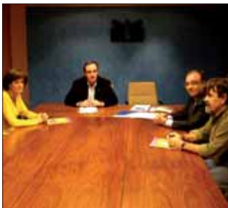
Un momento de la firma del convenio.

Esta es la segunda ocasión en la que varios ayuntamientos y el Fondo Municipal promueven conjuntamente la ejecución de un proyecto de cooperación al desarrollo trienal. En años anteriores, mediante con el mismo modelo, se financió la instalación de cinco sistemas de agua potable, la construcción de letrinas para las mismas comunidades, acciones de reforestación y otras de formación en salud y organización ■