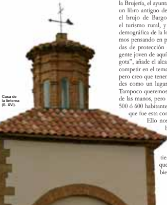
Casa de la Linterna (s. XVI).

Ello nos permitiría hacer rentables algunos negocios que ahora no pueden mantenerse por falta de clientela, como las tiendas, y otros servicios, que también contribuyen al bienestar de los vecinos”.