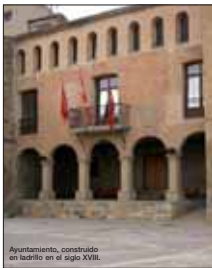
Ayuntamiento, construido en ladrillo en el siglo XVIII.