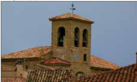
Torre de la iglesia barroca (S. XVI).